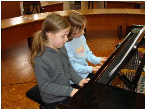
Klavier-Nachwuchs im Dossenheimer Rathaus

den dortigen Flügel zum Erklingen bringen durften. Mit Enthusiasmus und Spielfreude musizierten bei dieser Premiere 37 Pianistinnen und Pianisten im Alter von sechs bis 15 Jahren.