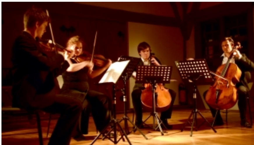
Vielversprechende europäische Nachwuchsmusiker beim Podium Festival in Esslingen

Schon am Eröffnungskonzert am Donnerstag, den 23.4. zeichnete sich ab, dass in Esslingen und der Region ein starkes Interesse an neuen kulturellen Angeboten herrscht. Im vollbesetzten Bürgersaal des Alten Rathaus erklangen mit dem Schostakowitsch Streichoktett die ersten, kräftigen Klänge aus den Instrumenten von acht jungen, herausragenden Musikern, die das Publikum begeisterten. Schon beim Auftakt wurde klar, dass dieses Festival eine ganz besondere Philosophie verfolgt: es wird ausschließlich von jungen Menschen getragen und hat dennoch einen hochprofessionellen Anspruch. Es wurde gezeigt, dass die jugendliche Frische der Formate und der Aufmachung sich mit hoher künstlerischen Qualität vereinen lässt. Auch die Programmierung war unorthodox, so wurde allein im Eröffnungskonzert eine gewaltige Spannweite von Klassikern bis zur Uraufführung, von der Intimität der berühmten Klavierballaden von Brahms bis zur orchestralen Fülle des a-Moll Quartetts des vergessenen Spätromantikers Anton Arensky geschaffen.