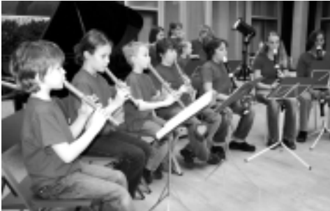
Das Flötenensemble eröffnete das Reutlinger Konzert

Barock bis zu zeitgenössischer Straßenmusik. Ein Duo Querflöte mit Klavier zeigte beeindruckend bei einem Satz aus einer Sonate von J.S. Bach, welches hohe musikalisches Niveau junge Menschen unter fachkundiger Anleitung ihrer Lehrer erreichen können.