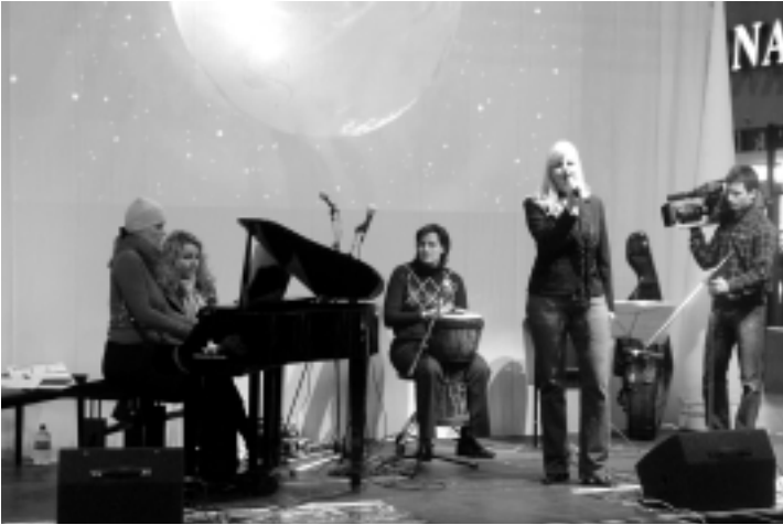
Calla Music Planet auf der ersten Pop-Open

Zum zweiten Mal nach 2004 unterhielten die Protagonisten von Calla Music Planet das begeisterte Publikum im Stuttgarter Hauptbahnhof mit einem kurzweiligen, der Bahnhofssituation angepassten Bühnenprogramm. Anlass war die erste Musikmesse Baden-Württembergs, die Pop-Open Stuttgart.