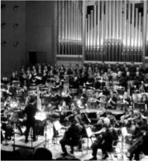
„Music for Film“ in der Stuttgarter Musikhochschule