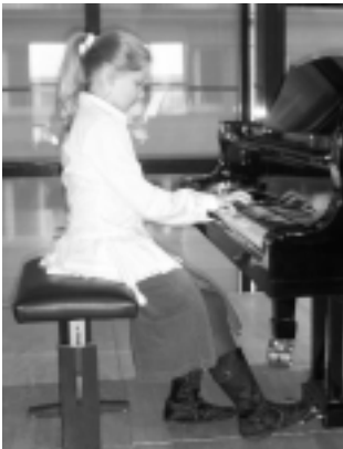
Beim Schülerkonzert in Stuttgart

Am 17. Februar fand im Orchesterprobenraum der Musikhochschule das 56. Schülerkonzert des Ortsverbandes Stuttgart statt. Schülerinnen und Schüler in den Fächern Klavier, Gesang und Violine – darunter Bewerber für das Musikstudium und die Studienstiftung des Deutschen Volkes – zeigten sich mit einem breiten Repertoire, dessen Schwerpunkt auf der Romantik lag, aber von J. S. Bach bis zur zeitgenössischen Moderne reichte. Das nächste Schülerkonzert des Ortsverbandes, ebenfalls an der Musikhochschule Stuttgart, ist für November vorgesehen.