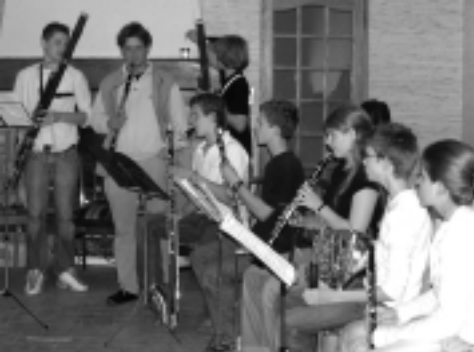
Spaß im Ensemble: balance in Frankreich