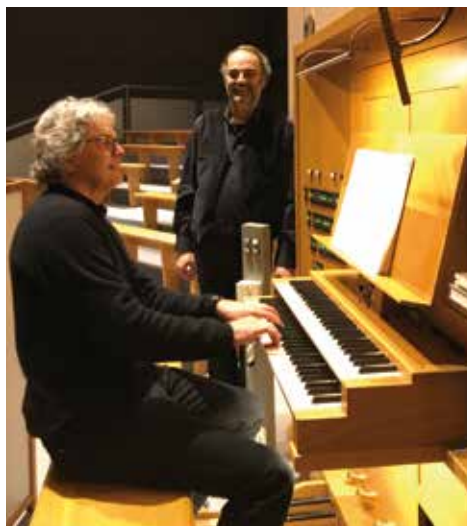
Silcher_Splitter_ThomasUngerer/Sebas-tian Hoch ©mak