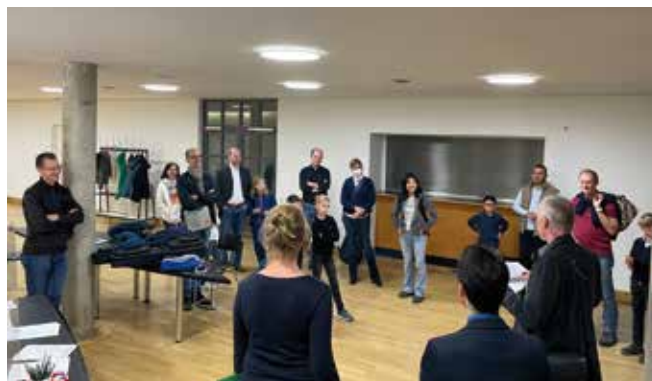
Verkündung Ergebnisse Gitarre AG 1