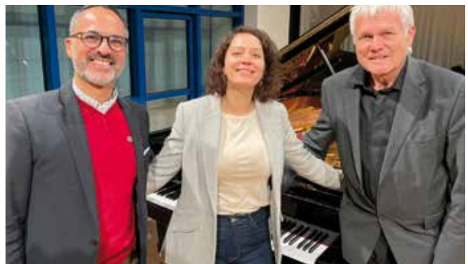
Jury Klavier