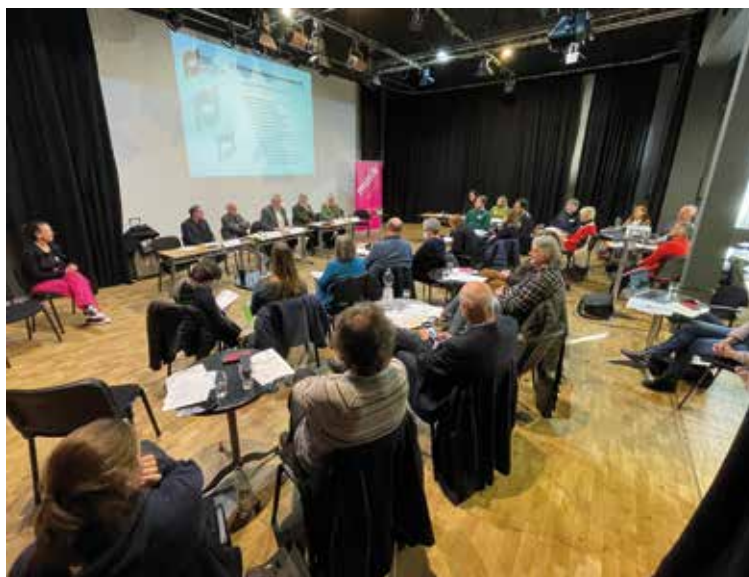
59. Bundesdelegiertenversammlung des DTKV in der Kulturwerkstatt Westend in Bremen